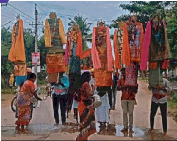
పరిరక్షించేందుకు అల్లాహ్ ప్రసన్నత కోసం మదీనా నుండి కర్బాలాకు వచ్చి యుద్ధంలో వీరమరణం పొందిన వీరి త్యాగలను స్మరించుకుంటు ప్రతి సంవత్సరం జరుపుకునే పండుగ మోహారం.