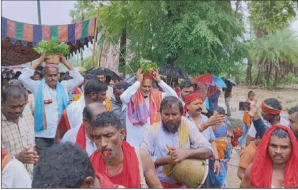
సుల్తానాబాద్ జూలై 21 (ప్రజా జ్యోతి)