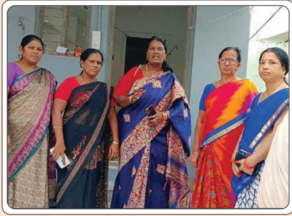
భద్రాచలం, జూలై 26, ప్రజాజ్యోతి