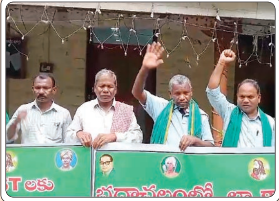
భద్రాచలం, జూలై 26, ప్రజాజ్యోతి