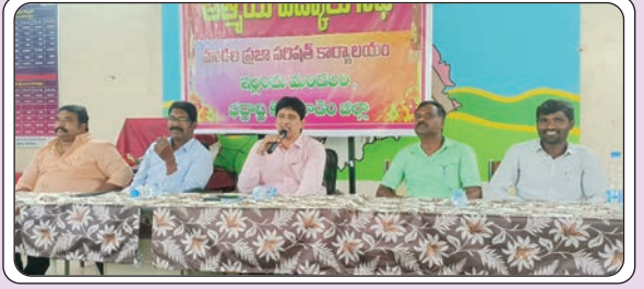
ఇల్లందు, జూలై 26, ప్రజాజ్యోతి: