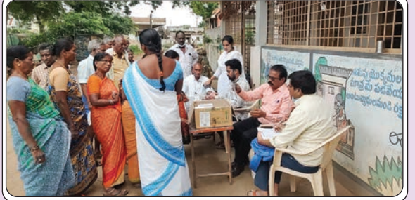
జూలూరుపాడు, జూలై 26 ప్రజాజ్యోతి