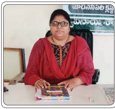
పైబడి 59 సంవత్సరాల వయస్సు గల కొత్త వారు, లేదా నామిని చనిపోయిన వారు, నామిని చేర్చులు,

మార్పులు లాంటివి జూలై 30 వ తారీఖు వరకు దరఖాస్తు చేసుకునే అవకాశం ఉందని అన్నారు. అదే విధంగా ఇటీవల ప్రభుత్వం జారీ చేసిన ఆర్ ఓ ఎఫ్ ఆర్ పట్టాలు పొందిన రైతులు కూడా రైతు బీమా పథకానికి దరఖాస్తు చేసుకోవచ్చునని సూచించారు. రైతు బీమా పథకం చాలా విలువైనదని, ఏ కారణం చేతనైనా రైతు చనిపోతే వారి కుటుంబ సభ్యులకు 5 లక్షల బీమా ప్రభుత్వం అందిస్తుందని, తద్వారా ఈ పథకం రైతులకు ఆసరాగా నిలుస్తుందని తెలిపారు. రైతు ఆడార్ కార్డ్, పట్టా పాస్ పుస్తకం, నామిని ఆడార్ కార్డ్ ల జిరాక్సులు సంబంధిత క్లర్క్ ఏ ఈ ఓ కి ఇచ్చి ఆన్లైన్ చేయించుకోవాలని కోరారు. కావున ఈ అవకాశాన్ని మండల రైతాంగం సద్వినియోగం చేసుకోవాలని కోరారు.