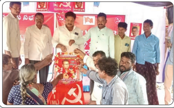
ములకలపల్లి, జూలై 23, ప్రజాజ్యోతి: