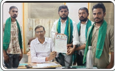
జూలూరుపాడు, జూలై 23, ప్రజాజ్యోతి

అధికారుల నిర్లక్ష్యం, బాధ్యతారాహిత్యంతో పాలన గాడితప్పింది. ఉన్నతాధికారుల పర్యవేక్షణ లోపం, క్షేత్రస్థాయిలో పట్టించు లేక పోవడంతో.. పల్లెలు సమస్యల వలయంలో చిక్కుకుంటున్నాయి. జూలూరుపాడు మండలం కొమ్ము గూడెం గ్రామస్థలకు సమస్యలు శాపంగా మారాయి. భరించలేని దుర్గుంధం, చిత్తడిగా మారిన బురద రోడ్లు, అసంపూర్తి పనులు వ్యాధులకు ఊతమిస్తోంది. సమస్యలు నిత్యకృత్యంగా కళ్లెదుటే సాక్షాత్కరిస్తున్నా.. పరిష్కార మార్గానికి మోక్షం లేకుండా పోయింది.