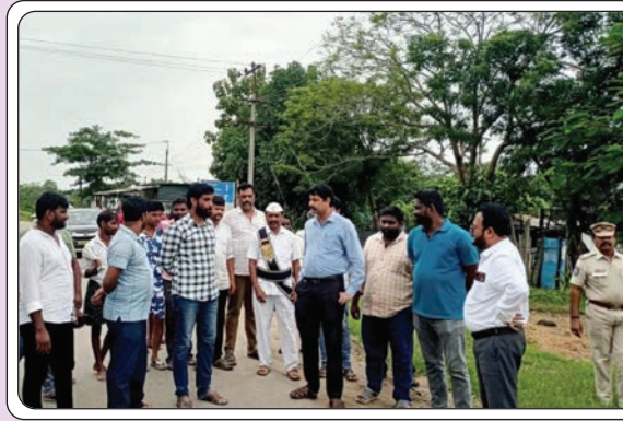
బూర్గంపాడు, జూలై 23, ప్రజాజ్యోతి

ముంపు ప్రాంత ప్రజలు సైతం అధికారులకు సహకరించాలి భద్రాచలం ఆర్డీవో దామోదర్