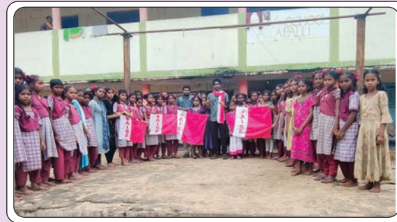
అళ్లపల్లి, జూలై 23, ప్రజాజ్యోతి