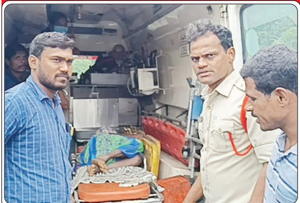
(మొదటి పేజీ తరువాయి...)

తమకు రోడ్డు మార్గం కల్పించండి సారు అంటూ అధికారులను ప్రజాప్రతినిధులను వేడుకుంటున్నారని అదే క్రమంలో బూర్గంపాడు మండలం సారపాక శ్రీరాంపురం ఎస్పీ కాలనీ గిరిజన మహిళలకు రెండు రోజుల నుంచి ఆరోగ్యం బాగాలేక లేవలేని స్థితిలో ఉన్న మహిళను సోమవారం కావిడి పై బురదలోనే మూసుకుంటూ రోడ్డు మార్గాన తీసుకొచ్చారు. ఈ వర్షకాలం అంతా ఇలాగే బాధపడాలని ఆవేదన వ్యక్తం చేస్తున్నారు. ఇకనైనా అధికారులు ప్రజాప్రతినిధులు జోక్యం చేసుకొని ఆ గ్రామానికి రోడ్డు మార్గం కల్పించాలని వారు ముక్తకంఠంతో కోరుతున్నారు.