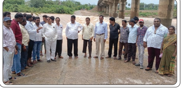
పాల్గొనడం, జూలై 22, ప్రజాజ్యోతి: