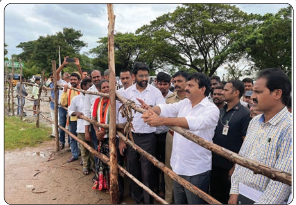
మాట్లాడుతూ మండలంలోని లోతట్టు ప్రాంత ప్రజలను అప్రమత్తం చేస్తూ వారికి సహాయ సహకారాలు అందించాలని కోరారు. ప్రజలకు ఎటువంటి