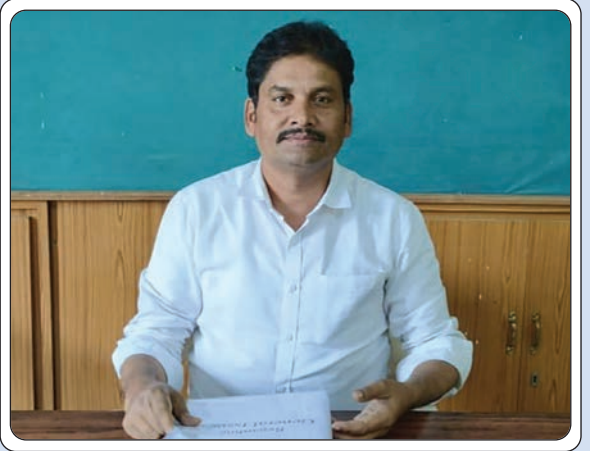
ప్రజాజ్యోతి జూలై 22, కొత్తగూడెం