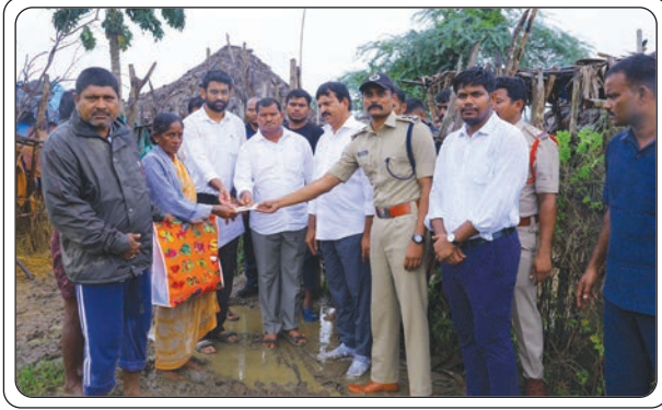
అశ్వాసావు పేట, జూలై 22, ప్రజాజ్యోతి:

తెలంగాణలో ప్రజాప్రభుత్వం నడుస్తుందని, రైతు రాజుగా ఉన్న రాజ్యమని రాష్ట్ర రెవెన్యూ, సమాచారశాఖ మంత్రి పొంగులేటి శ్రీనివాసరెడ్డి అన్నారు. భారీవర్షాల కారణంగా ఈ నెల 18వ తేదీ వరదఉధృతి ఒక్కసారిగా పెరగటంతో మండలంలోని గుమ్మడపల్లి గ్రామం వద్ద గల