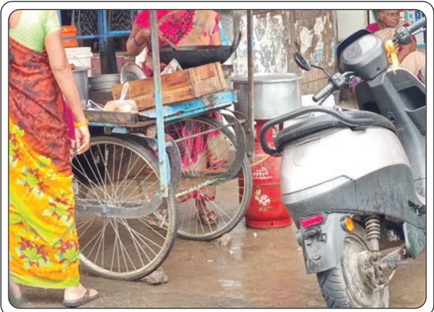
సానికే ఏజెన్సీల సహాయంతో రెచ్చిపోతున్న దళాకారులు

పట్టణానికి చెందిన కొందరు గ్యాస్ ఏజెన్సీ నిర్వాహకులు చిరు వ్యాపారులకు గుట్టుగా డొమెస్టిక్ సిలిండర్ల విక్రయాలు జరిపి తమ వ్యాపారాన్ని చక్కపెట్టుకుంటున్నారు. దీంతో డొమెస్టిక్ సిలిండర్ల విక్రయాలు దళారులకు కాసులు కురిపిస్తున్నాయి. ఇటీవల కాలంలో కమర్షియల్ సిలిండర్ల ధరలు భారీగా పెరగడంతో గృహ వినియోగదారుల వినియోగించే సిలిండర్ల ఖాతా మార్కెట్ కు దర్జాగా తరలిస్తున్నారు. పట్టణంలోని పలు ప్రాంతాల్లోని కూడళ్లలో నిర్వహించే టిఫిన్, టీ సెంటర్ నిర్వహకులు, చిరుహోటళ్లకు గుట్టు చప్పుడుగా సరఫరా చేస్తున్నారు. గృహ అవసరాలకు గ్యాస్ గ్యాస్ సరఫరా చేసే సిబ్బంది దళారులతో చేతులు కలిపి అక్రమ సంపాదన కూడబెట్టుకుంటున్నారనే విమర్శలు వినిపిస్తున్నాయి. ప్రస్తుతం పలు గ్యాస్ 14.5 కేజీల సిలిండర్ ధర రూ. 952 ఉండగా, రవాణా చార్జీతో కలిపి రూ. 980 ఇస్తున్నారు. ఖాతా మార్కెట్ లో రూ. 1500 వరకు విక్రయాలు చేస్తున్నారు.