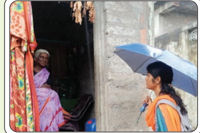
బూర్గంపాడు, జూలై 20, ప్రజాజ్యోతి