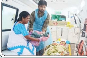
జూలూరుపాడు, జూలై 20, ప్రజాజ్యోతి:

108 అంబులెన్స్ వాహనంలో గర్భిణి ప్రసవం పండంటి మగ బిడ్డకు జన్మనిచ్చిన ఘటన శనివారం జూలూరుపాడు మండలంలో చోటుచేసుకుంది.