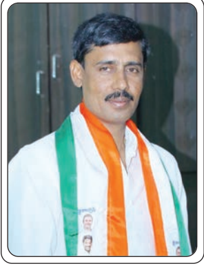
బూర్గంపాడు, జూలై 20, ప్రజాజ్యోతి

చెప్పిన సమయం కంటే ముందే రైతు రుణమాఫీ చేస్తున్నామని ముఖ్యమంత్రి రేవంత్ రెడ్డి ఉప ముఖ్యమంత్రి భట్టి విక్రమార్క తెలంగాణ రాష్ట్ర మంత్రివర్గులు పొంగు లేటి శ్రీనివాస్ రెడ్డి తుమ్మల నాగేశ్వరరావు, తెలిపిన విధంగా ఇచ్చిన మాట నిలబెట్టుకున్నారు. చిత్తశుద్ధి ఉంటే ఏదైనా సాధ్యమేనని కాంగ్రెస్ ప్రభుత్వం నిరూపించింది రేపటి రాజకీయ భవిష్యత్తు రుణమాఫీతో ముడిపడి ఉంది. ఆగస్టు 15 లోపు రుణమాఫీ చేస్తామని ప్రభుత్వం హామీ ఇవ్వగా చెప్పిన దాని కంటే ముందే రుణ మాఫీ చేసిన ప్రభుత్వం కాంగ్రెస్ ప్రభుత్వం అని అన్నారు. రుణమాఫీ చేస్తామని చెప్పే ఇది అసాధ్యం అని చాలా మంది అన్నారు. కానీ చిత్తశుద్ధి ఉంటే అన్నీ సాధ్యమేనని కాంగ్రెస్ ప్రభుత్వం నిరూపించింది. పదేళ్లు అధికారంలో ఉన్న కేసీఆర్ 28 వేల కోట్లు కూడా రైతు రుణమాఫీ చేయలేక పోయారు. రైతు రుణమాఫీ పై కాంగ్రెస్ ప్రభుత్వానికి చిత్తశుద్ధి ఉంది కాబట్టే కష్టమైన రుణమాఫీ చేస్తున్నట్లు కాంగ్రెస్ ప్రభుత్వం నిర్ణయం తీసుకోవడం జరిగింది అని ఈ సందర్భంగా తెలిపారు.