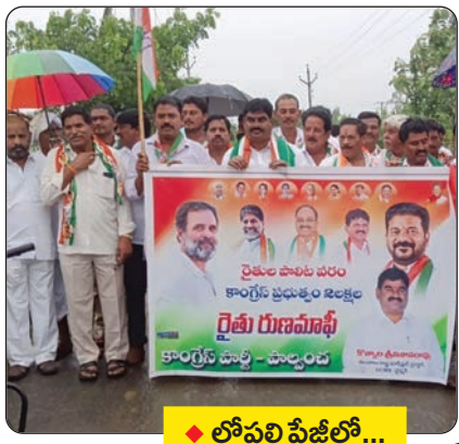
◆ లోపలి పేజీల్లో...