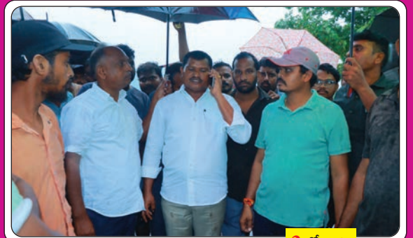
2 లో... ▶