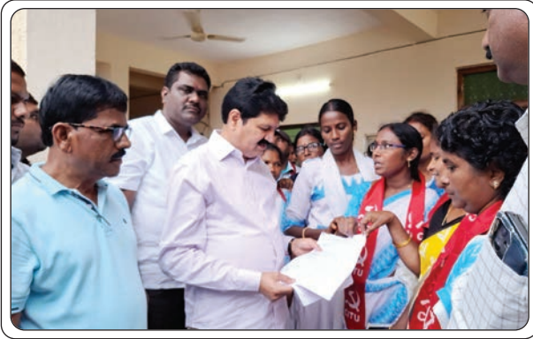
- అసెంబ్లీ సమావేశాల్లో చర్చిస్తం : ఎమ్మెల్యే హామీ