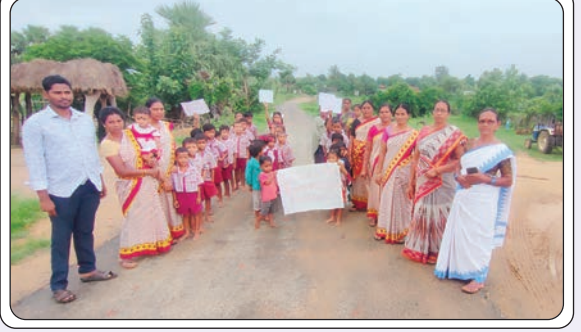
అళ్ళపల్లి, జూలై 18, ప్రజాజ్యోతి: