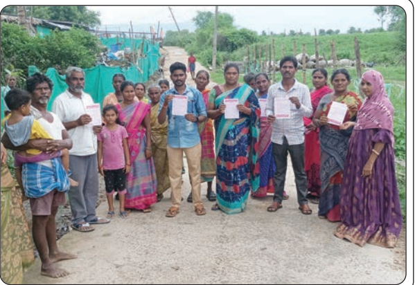
చర్ల, జూలై 18, ప్రజాజ్యోతి: