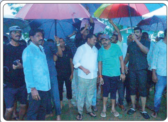
అశ్వారావు పేట, జూలై 18, ప్రజాజ్యోతి:

బంగాళాఖాతంలో ఏర్పడే అల్పపీడన ప్రభావంతో భారీవర్షాలు కురుస్తున్న నేపథ్యంలో లోతట్టు ప్రాంతాల ప్రజల అప్రమత్తంగా ఉండాలని ఎమ్మెల్యే జారే ఆది నారాయణ అన్నారు. గుమ్మడవల్లి వద్ద వరద ముంపు ప్రాంతాలను, లోతట్టు ప్రాంతాల ప్రజలను సురక్షిత ప్రాంతాలకు తరలించే ప్రక్రియను పోలవరం ఎమ్మెల్యే చిర్ల బాలరాజుతో కలిసి ఆయన పరిశీలించారు. సహాయక చర్యల్లో ఎటువంటి అలసత్వం ప్రదర్శించకుండా అధికారులు ఎప్పటికప్పుడు జాగ్రత్తలు తీసుకుంటూ ప్రజలకు ఏ ఇబ్బందులు లేకుండా చూడాలన్నారు.