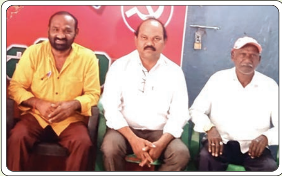
మణుగూరు రూరల్, జూలై 18, ప్రజాజ్యోతి: