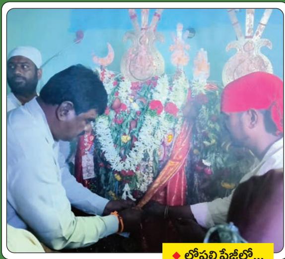
◆ లోపలి పేజీల్లో...