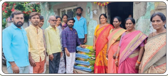
ఇల్లందు, జూలై 17, ప్రజాజ్యోతి: