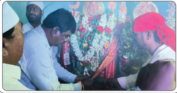
పాల్వంచ, జూలై 17, ప్రజాజ్యోతి: