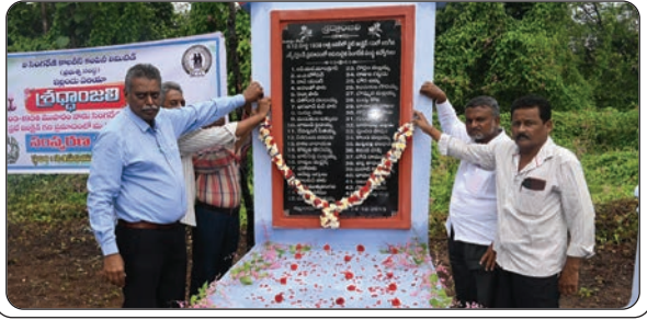
ఇల్లందు, జూలై 17, ప్రజాజ్యోతి: