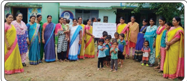
జూలూరుపాడు, జులై 15, ప్రజాజ్యోతి