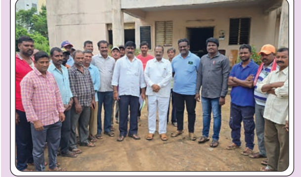
ఇల్లందు, జులై 15, ప్రజాజ్యోతి:

-వర్షాకాలంలో ప్రజలు ఎవరు ఇబ్బంది పడవద్దు