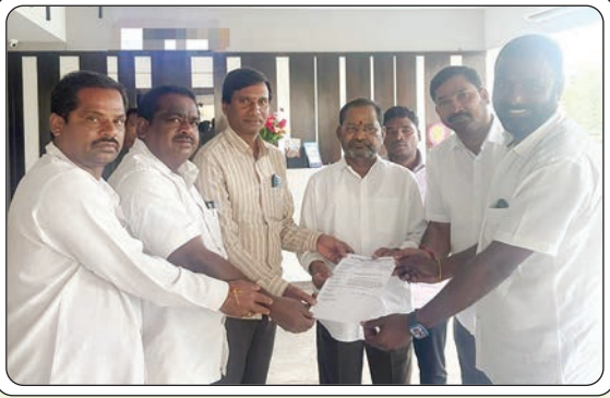
ఇల్లందు, జులై 15, ప్రజాజ్యోతి: