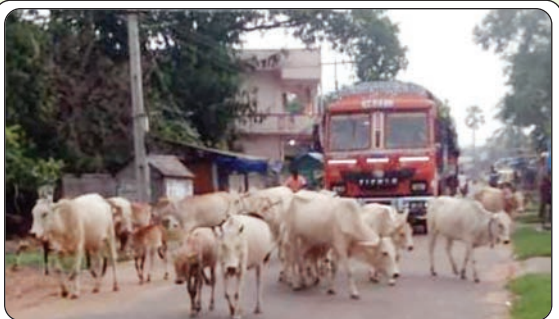
చర్ల, జులై 15, ప్రజాజ్యోతి:

చర్ల మండలం కేంద్రంలో ప్రధాన రహదారులపై వాహనదారులకు ఇబ్బందులు కలిగిస్తున్న పశువులు, రహదారులపై గుంపులు, గుంపులు గా ఉన్న పశువుల వల్ల వాహనదారులు యాక్సిడెంట్ అయినా సందర్భాలు ఉన్నాయి. పశువుల నిర్లక్ష్యంగా వదిలేసిన, పశువుల యజమాన్యులకు అనేకసార్లు అధికారులు రోడ్లపై పశువులను కట్టివేయొద్దు, రోడ్లపై వదలొద్దు అని ఎన్నో మార్లు మొరపెట్టుకున్న నిర్లక్ష్యంగా వహిస్తున్న పశువుల యజమాన్యులు, చర్లమండల కేంద్రంలో ఉన్న ప్రధాన రహదారిపై పాదచారులకు, వాహనదారులకు, పలు మార్లు పశువులు కుమ్మలాటల వలన వారికి దెబ్బలు కలిగిన సందర్భాలు అనేకం ఉన్నాయి. అధికారులను నిర్లక్ష్యమా! మమ్మల్ని ఎవరు ఏమనరు, ఏమి చేయరు అని ఒక ధైర్యమా! పశువుల యజమాన్యులు చేస్తున్న నిర్లక్ష్యం కారణంగా ఎందరో వాహనదారులకు, పాదచారులకు, మండల కేంద్రంలో రోడ్డు పైకి రావాలంటే, ఇబ్బందిగా మారింది. నిత్యం నరుకులకు, అవసరాల కోసం వచ్చే ప్రజలకు ఇబ్బందులు కలిగిస్తున్న, రోడ్లపై ఉన్న పశువులను బందెలదొడ్డిలో పెట్టాలని, లేదా గోశాలకు తరలించాలి. పశువులను రోడ్లపై వదిలేసి, స్థానిక ప్రజలను ఇబ్బందులకు గురిచేస్తున్న, పశువుల యజమాన్యులపై చర్యలు తీసుకోవాలని, స్థానిక ప్రజల డిమాండ్ చేస్తున్నారు.