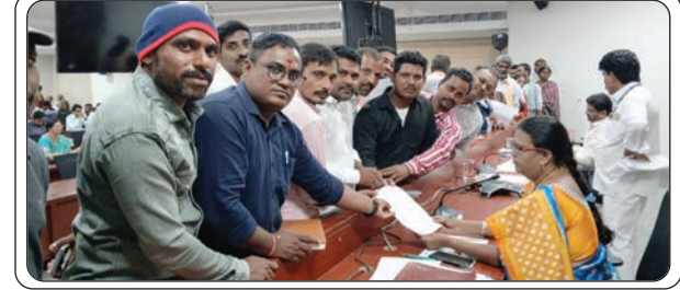
బేకులపల్లి, జులై 15, ప్రజాజ్యోతి:

రాష్ట్ర ప్రభుత్వం ప్రతి గ్రామంలో మీ సేవ కేంద్రాలను ఏర్పాటు చేసేందుకు ప్రభుత్వం ఏర్పాటు చేస్తుండగా, గ్రామాలలో ఇప్పటికే గత 15 సంవత్సరాలుగా మీ సేవ కేంద్రాలను నడుపుతూ ప్రభుత్వ సర్వీసులను ప్రజలకు అందిస్తున్న సి ఎస్. పి ల ద్వారానే గ్రామాలలో మీ సేవ కేంద్రాలను ఏర్పాటు చేయాలని కలెక్టర్ కార్యాలయంలో నిర్వహిస్తున్న ప్రజావాణి కార్యక్రమంలో వినతిపత్రం అందజేశారు. ఈ సందర్భంగా వారు మాట్లాడుతూ రాష్ట్రవ్యాప్తంగా ప్రతి గ్రామంలో కొన్ని సంవత్సరాలుగా సీఎస్సీలు, ఈ గవర్నెన్స్ ద్వారా ప్రజలకు అనేక సేవలందిస్తున్నామని, కరోనా టైంలో అనేక సేవలు అందించామని, కేంద్ర ప్రభుత్వం ప్రవేశ పెట్టిన ఆయుష్షాన్ భారత్, పిఎం కిసాన్, పిఎం జెజె, పిఎం జెవై, ఆరోగ్యశ్రీ సర్వీసులను గ్రామాలలో ప్రజలకు అందిస్తున్నామని, తమకే స్టేట్ సర్వీసులు ప్రావైడ్ చేసి మీ సేవ కేంద్రాలను ఇవ్వాలని రాష్ట్ర ప్రభుత్వానికి విజ్ఞప్తి చేశారు. సీఎస్సీ కేంద్రాల యజమానులు రూమ్ రెంటు కట్టలేని పరిస్థితిలో ఉన్నప్పటికీ ప్రజలకు సర్వీస్ అందిస్తున్నామని, ఇప్పుడు గ్రామాలలో మీ సేవ కేంద్రాలను ఏర్పాటు చేస్తే సీఎస్సీ కేంద్రాల జీవనోపాధి కోల్పోయి రోడ్డును పడార్చి వస్తుందని వారన్నారు. సీఎస్సీ కేంద్రాలను గుర్తించి ప్రభుత్వం వారికి మీ సేవ కేంద్రాలు విఎల్ ఈ కేటాయించినట్లయితే ప్రజలకు మెరుగైన సేవలు అందిస్తామని, సీఎస్సీ సెంటర్లకే మీ సేవ కేంద్రాల కేటాయించాలని ప్రజావాణిలో కలెక్టర్ కు వినతిపత్రం అందజేశారు. ఈ కార్యక్రమంలో సిఎస్సీ పిలు పాల్గొన్నారు.