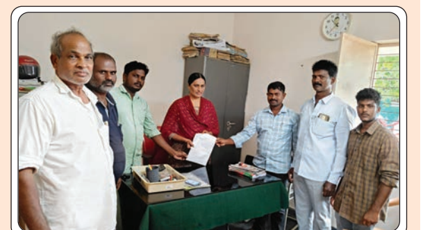
జూలూరుపాడు, జులై 15, ప్రజాజ్యోతి