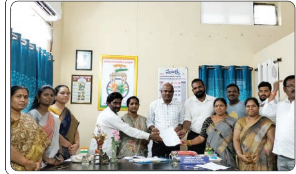
ఇల్లందు, జులై 15, ప్రజాజ్యోతి:

తమ వార్డులలో నెలకొన్న పారిశుధ్యం, వీధిలైట్ల సమస్యలను త్వరితగతిన పరిష్కరించాలని కోరుతూ సోమవారం పలువురు మున్సిపల్ వార్డు కౌన్సిలర్లు మున్సిపల్ కమిషనర్ కు వినతిపత్రం అందజేశారు. ఈ సందర్భంగా కౌన్సిలర్లు మాట్లాడుతూ ఇల్లందు మున్సిపాలిటీలో పారిశుధ్యం సరిగ్గా లేకపోవడం వలన ఊరికి కాలువలు పూర్తిగా నిండి దుర్గంధం వెదజల్లుతున్నాయని పేర్కొన్నారు. దీంతో ఆ కాలువల ద్వారా దోమల సంచారం పెరిగి ప్రజలు అనారోగ్య సమస్యలతో ఇబ్బందులు పడుతున్నారని ఆవేదన వ్యక్తం చేశారు. వర్షాకాలం కావడంతో ఆ దోమల సంచారం వల్ల బ్రైఫాయిడ్, మలేరియా, డెంగ్యూ జ్వరాలతో ప్రజలు అసుపత్రులకు వెళ్ళవలసి వస్తుందన్నారు. వర్షాకాలం కంటే ముందుగా పారిశుధ్య పనులు పూర్తి చేయకపోవడం వల్లనే ఈ పరిస్థితి నెలకొందని తెలిపారు. తక్షణమే మిషన్ మోడ్ లో పారిశుధ్య పనులు నిర్వహించాలని కోరారు. వర్షాకాలం వల్ల వీధిలైట్లు లేకపోవడంతో పాములు, కీటకాల సంచారం వల్ల ప్రజలు ప్రమాదాలకు గురి అయ్యే అవకాశం ఉందన్నారు. నీటి సరఫరా లోపం వల్లనే ప్రజలు దురదలు, దద్దురుల వల్ల వైద్యశాలకు వెళ్ళవలసి వస్తుందని ఆరోపించారు. వైద్యులు మాత్రం నీటి కలుషితం వలనే ఇలా దురదలు, దద్దురులు రావడం జరుగుతుందని చెబుతున్నారన్నారు. వార్డులలో నెలకొన్న సమస్యలను పరిష్కరించి ప్రజల ఆరోగ్యాలను కాపాడాలని, లేనియేడల బిఆర్ఎస్ పార్టీ అధ్యక్షులలో దశవారిగా ఉద్యమాలు చేస్తామని హెచ్చరించారు. ఈ కార్యక్రమంలో వార్డు కౌన్సిలర్లు చీమల సుజాత, సిలువేరు అనిత, సామల మాధవి, పాబోలు స్వాతి, సంద బిందు, తోట లలిత శారద, చెరుపల్లి శ్రీనివాస్, వాంకుడోతే తార, యలమండల వీణ, మున్సిపల్ కోఆప్షన్ సభ్యులు మసూద్ రబ్బూ, బిఆర్ఎస్ సీనియర్ నాయకులు సిలువేరు సత్యనారాయణ, నాయకులు సామల రవి తేజ, యలమండల వాసు, పాబోలు మణికిరణ్ తదితరులు పాల్గొన్నారు.