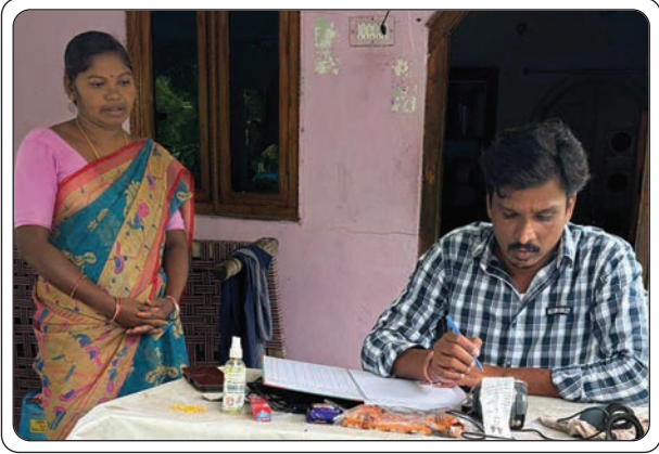
(మొదటి పేజీ తరువాయి...)

పోలీసులు పట్టుకున్నట్లు సమాచారం. అయినప్పటికీ ఎటువంటి తప్పిదాలు జరగలేదని అంతా సక్రమంగానే రేషన్ షాపుల డీలర్లు నిబంధనలను అతిక్రమించకుండా షాపులను నిర్వహిస్తున్నట్లు తెలిపారు. మరి మొన్నటి వరకు పట్టుపడ్డ రేషన్ బియ్యం ఎవరియో సివిల్స్ పై అధికారుల కేటెలియాలి. పత్రికల్లో వార్తా కథనాలు వచ్చినప్పుడల్లా అధికారులు ఆగమేఘాల మీద తూతూ మంత్రంగా తనిఖీలు చేసి చేతులు దులుపుకుంటున్నారు. ఒకవేళ కేసులు నమోదు చేసిన పెద్దతలకాయలను పదిలేసి అమాయకులపై ప్రతాపం చూపిస్తారు అన్న ఆరోపణలు కూడా లేకపోలేదు. తనిఖీలకు వచ్చే ముందు ముందస్తుగానే కొందరికి సమాచారం చేరవేసి నామమాత్రపు తనిఖీలు చేయడం సర్వసాధారణం అయిపోయింది. స్థానికంగా ఉండి ప్రతినెల దుకాణాలను పర్యవేక్షిస్తే పేదల బియ్యం అక్రమార్కులు దోచుకుపోకుండా కట్టిడి చేసిన వారు అవుతారు. కానీ పేదల బియ్యాన్ని దళారులు అడ్డగోలుగా దోచుకుంటున్న అధికారులు వారికి వత్తాసు పలుకుతూ అంతా సక్రమంగానే జరుగుతుందని కితాబు నివ్వడం పై పలు అనుమానాలు వ్యక్తమవుతున్నాయి.