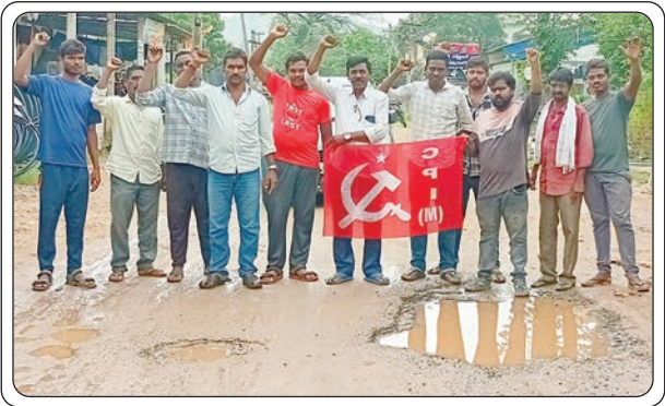
చర్ల, జులై 15, ప్రజాజ్యోతి: