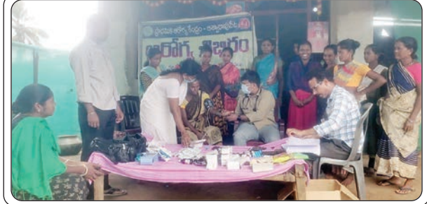
అశ్యా రావు వేట, జులై 15, ప్రజాజ్యోతి

పరిసరాల పరిశుభ్రతను పాటించండి... వినాయకపురం ప్రాథమిక ఆరోగ్య కేంద్రం వైద్యులు రాందాస్