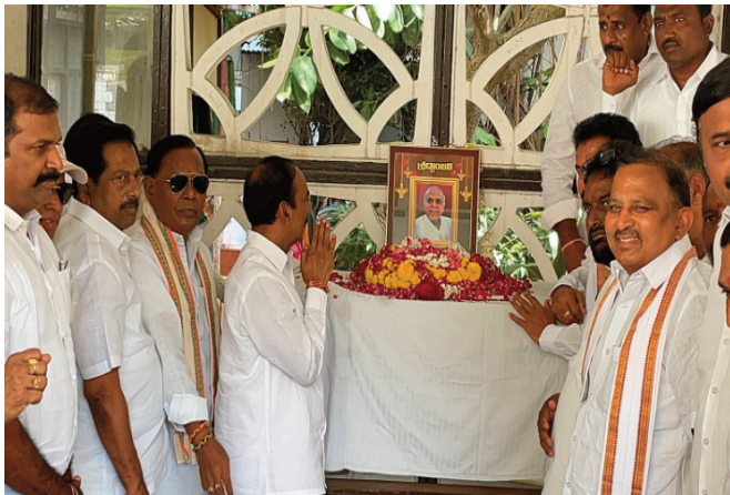
కూకట్ పల్లి, జూన్ 08 (ప్రజా జ్యోతి) : అతి సామాన్య వ్యక్తిగా జీవితం ప్రారంభించి అనేక రంగాల్లో అత్యున్నత స్థాయికి చేరిన రామోజీరావు మరణం తీరని లోటు అని మల్కాజిగిరి ఎంపీ ఈటెల రాజేందర్ అన్నారు. అనంతరం రామోజీరావు చిత్రపటానికి పూలమాలలు వేసి శ్రద్ధలు ఘటించారు. సందర్భంగా ఆయన

మాట్లాడుతూ వామపక్ష భావజాలం కలిగిన రామోజీరావు తన జీవితాంతం అత్యంత నిబద్ధత, క్రమశిక్షణ, పట్టుదలతో బతికిన వ్యక్తి అని అన్నారు. తలపెట్టిన ఏ పనిలో అయినా సరే అత్యున్నత నాణ్యత ప్రమాణాలు, నైతిక విలువలు పాటిస్తూ అందరికీ ఆదర్శంగా నిలిచిన మహనీయుడు అని తెలిపారు. పత్రిక, సినిమా, టీవీ తదితర రంగాల్లో రామోజీరావు సాధించిన విజయాలు