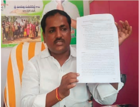
మేడిపల్లి జూన్ 7 ప్రజాజ్యోతి కేవలం డివిజన్ అభివృద్ధి

- వ్యక్తిగత విమర్శలు చేస్తే సహించేది లేదు - చట్టపరమైన చర్యలకు సిద్ధం - జక్కపై కార్పొరేటర్ సుభాష్ నాయక్ పైర్