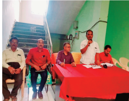
పాపన్నపేట, జూన్ 07(ప్రజాజ్యోతి): బడిడు పిల్లలు