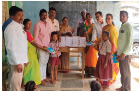
దోమ జూన్ 26 (ప్రజా జ్యోతి) : మండల కేంద్రంలోని అంబేద్కర్ నగర్ ప్రైమరీ స్కూల్ విద్యార్థులకు ఒక