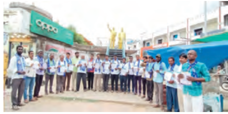
పరిగి, జూన్ 26 : (ప్రజా జ్యోతి) పరిగిలో పట్టణంలో డాక్టర్ బీఆర్ అంబేద్కర్ విగ్రహం దగ్గర దోమ మండలం ప్రాధాన్య పల్లి గ్రామంలో జూన్ 30 న