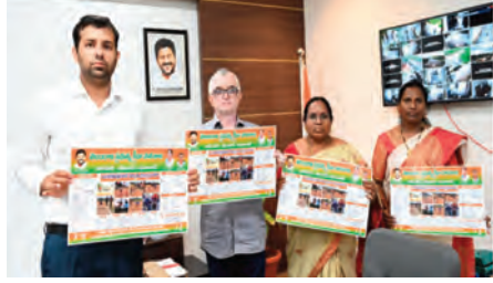
వికారాబాద్ ప్రతినిధి, జూన్ 26(ప్రజా జ్యోతి): రేపు 28 జూన్ 2024 నాడు కెరెల్లి సత్యసాయి గ్రామీణ సార్వజనిక కేంద్రం వద్ద ఎం ఎస్ జె క్యాన్సర్ ఆసుపత్రి హైదరాబాద్ వారి సౌజన్యంతో ఉచితంగా “క్యాన్సర్ వ్యాధి నిర్ధారణ పరీక్షలు” నిర్వహించడం

జరుగుతుందని సత్యసాయి సేవా సంస్థల అధ్యక్ష, ప్రధాన కార్యదర్శులతోపాటు, కెరెల్లి కన్వీనర్ లు ఒక ప్రకటనలో తెలిపారు. ఈ మధ్యకాలంలో ఎంతోమందికి క్యాన్సర్ ఉన్నా కూడా 4వ స్టేజి వరకు తెలియకుండా అనారోగ్యానికి గురి అవుతూ కొన్ని రోజుల్లోనే చనిపోతున్నారని. మనకు లేకపోయినా ముందే పరీక్షలు చేసుకోవడం వల్ల ఒకవేళ కేన్సర్ వుంటే ఎమ్ ఎస్ జె హాస్పిటల్ వారిచే ఉచితంగా శ్రీట్యూట్ వుంటుందన్నారు. ఒక్కొక్క టెస్ట్ కి సుమారుగా 5నుండి 6 వేల రూపాయల వరకు ఖర్చు అవుతుందని అలాంటిది సత్యసాయి సేవా సంస్థల ద్వారా ఎమ్ ఎస్ జె వారు ఉచితంగా చేస్తున్నారని తెలిపారు. ప్రతి ఒక్క మహిళ ఈ అవకాశాన్ని ఉ పయోగించుకోవాలని ప్రకటనలో కోరారు.