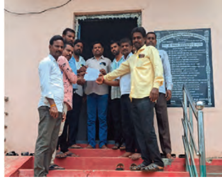
నారాయణపేట జిల్లా ప్రతినిధి ప్రజాజ్యోతి జూన్