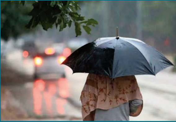
తిరువనంతపురం, జూన్ 1:

కేరళలో విస్తారంగా వర్షాలు విరిగిపడుతున్న కొండచరియలు ఆరు జిల్లాల్లో ఎల్లోఅలర్డ్ జారీ