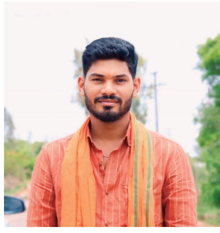
కల్వకుర్తి జూన్ 14 ప్రజాజ్యోతి జాతీయ బీసీ కమిషన్