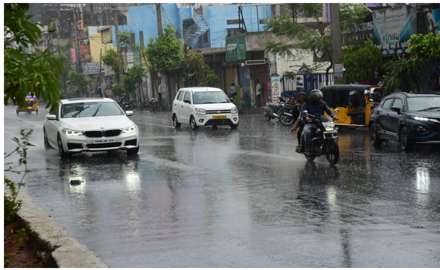
నిజామాబాద్ జూన్ 2: జిల్లాను తొలకరి పలకరించింది. సోమవారం సాయంత్రం విద్యుత్ సరఫరాకు అంతరాయం కలిగింది.