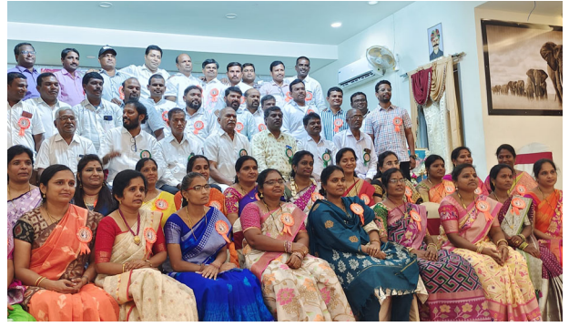
విద్యార్థులు తదితరులు పాల్గొన్నారు.