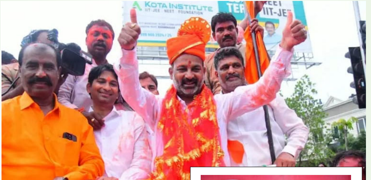
జమ్మికుంట, జూన్ 9 (ప్రజాజ్యోతి):