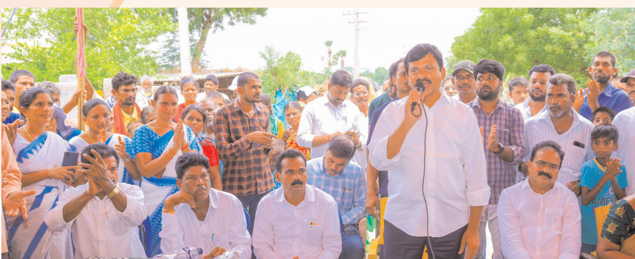
ఖమ్మం ప్రతినధి జూన్ 22 ప్రజా జ్యోతి : పేదలకు ఇచ్చిన హామీలను నెరవేర్చడంలో ఇందిరమ్మ ప్రభుత్వం వెనక్కు తగ్గే ప్రసక్తే లేదని, ఎన్నికల సమయంలో ఏ హామీలను ఇచ్చామో వాటన్నింటినీ విడతల వారిగా

నెరవేర్చేందుకు ప్రభుత్వం చిత్తశుద్ధితో ఉందని తెలంగాణ రెవెన్యూ, గృహనిర్మాణం, సమాచార శాఖల మంత్రి పాంగులేటి శ్రీనివాస రెడ్డి పేర్కొన్నారు. నేలకొండపల్లి మండల పర్యటనలో భాగంగా మోటాపురం, శంకరగిరి తండా, రాజేశ్వరపురం, అమ్మగూడెం, కోరట్లగూడెం, కోనాయిగూడెం, అరగూడెం, ఆచార్యగూడెం, బోదులబండ, మండ్రాజుపల్లి తదితర గ్రామాలను సందర్శించారు. ఆయా గ్రామాల్లో ప్రజల నుంచి వినతులను స్వీకరించారు. వాటి పరిష్కారానికి సంబంధిత అధికారులను ఆదేశించారు. ఈ సందర్భంగా మంత్రి పాంగులేటి మాట్లాడుతూ... ఇచ్చిన మాట ప్రకారం రైతులకు రుణమాఫీ కోసం అన్ని సమకూరుస్తున్నామన్నారు. ఇందిరమ్మ రాజ్యంలో వచ్చేనెల జూలై నుంచి రుణమాఫీ అమలువుతుందని తెలిపారు. రూ.31 వేల కోట్లతో రైతుల రుణమాఫీ జరుగుతుందని వెల్లడించారు. ప్రభుత్వం చేయబోయే రుణమాఫీని తట్టుకోలేక ప్రతిపక్షం వాళ్లు నోరుజారి ఏవేవో మాట్లాడుతున్నారని పేర్కొన్నారు. ఇందిరమ్మ ఇళ్లు పేదవాళ్లలో అతిపేదవాళ్లకు ముందు మంజూరు చేస్తామన్నారు. లిఫ్ట్ లు రిపేరు చేయించి రైతులకు సాగునీటి ఇబ్బందులు లేకుండా చూస్తామని హామీ ఇచ్చారు. రాజేశ్వరపురం గ్రామంలో నేలకొండపల్లి మండల కళ్యాణ లక్ష్మి లబ్ధిదారులకు చెక్కులను పంపిణీ చేశారు. ఈ పర్యటనలో స్థానిక ప్రజాప్రతినిధులు, నాయకులు, కార్యకర్తలు, అభిమానులు పాల్గొన్నారు.