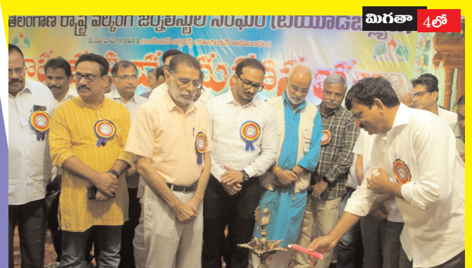
తలంగాణ రాష్ట్ర ఎల్యూగా జర్నలిస్టుల సంఘం (టియూడబ్ల్యూజే) మిరతా 4లో