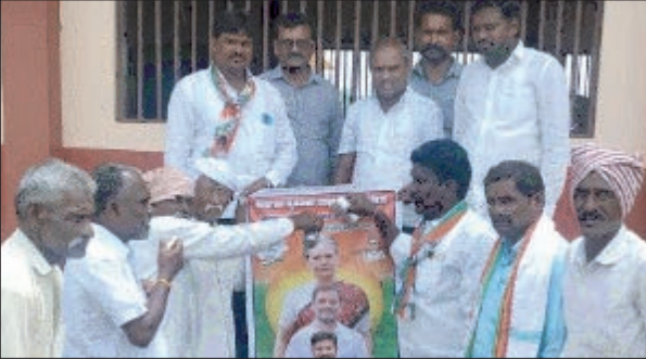
- కాంగ్రెస్ నాయకుల సంబరాలు