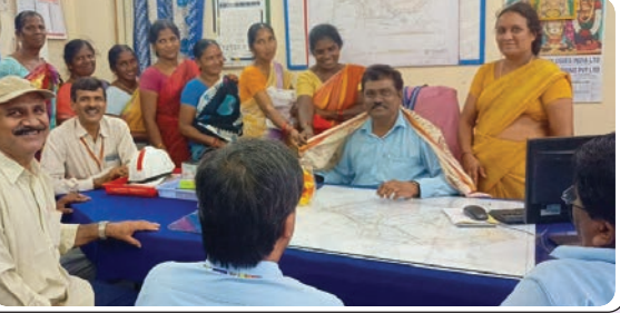
మణుగూరు, జూన్ 8, ప్రజాజ్యోతి: