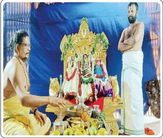
భద్రాచలం, జూన్ 8, ప్రజాజ్యోతి

భద్రాద్రి సీతారామచంద్రస్వామివారి దివ్యక్షేత్రంలో శనివారం అంతరాలయంలోని మూలవరులకు స్వర్ణ తులసి పూజలు నిర్వహించారు. తెల్లవారుజామున ఆలయ తలుపులు తెరిచి స్వామివారికి సుప్రభాత సేవ, ఆరాధన, ఆరగింపు, నిత్య హోమాలు, నిత్య బలిహారణం, సేవాకాలం తదితర పూజలను సంప్రదాయబద్ధంగా జరిపారు. అనంతరం స్వామివారి నిత్య కల్యాణ మూర్తులను బేదా మండపానికి తీసుకొని వచ్చి శాస్త్రోక్తంగా నిత్య కల్యాణం జరిపి, కల్యాణంలో పాల్గొన్న దాతలకు స్వామివారి ప్రసాదాలను, శేష వస్త్రాలను అందజేశారు.