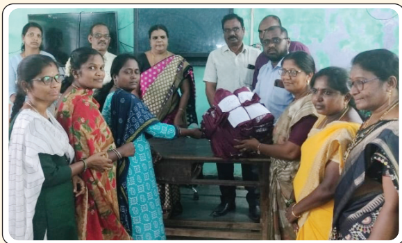
బేకులపల్లి, జూన్ 7, ప్రజాజ్యోతి: