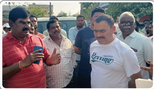
పాల్వంచ, జూన్ 7, ప్రజాజ్యోతి: