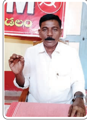
గ్రామాలలో వైద్యంపై సరైన అవగాహన సదస్సులు నిర్వహించకపోవడం అధికారులలోపం, స్పష్టంగా కనిపిస్తుంది. గ్రామపంచాయతీలలో బ్లిచింగ్ పౌడర్, పంచాయతీ పరిసరాల పరిశుభ్రత పనులు సరైన సమయంలో చేయకపోవడం, దోమల మందు పిచికారి, ముందస్తుగా చర్యలు చేపట్టకపోవడం వలన, దోమల పెరిగి, కుట్టి ప్రజలకు జ్వరాలు

విజయ కాలనీ, మొగలపల్లి, ఆనంద కాలనీ, సత్య నారాయణపురం, తేగడ, కొత్తపల్లి, పెద్దిపల్లి, చిన్న మిసి లేరు, ప్రాంతాల ప్రజలు విష జ్వరాలు వచ్చి ప్రాణాలతో కొట్టుమిట్టాడుతున్నారు. సరైన వైద్యం అందక, వైద్యం కోసం ప్రైవేట్ హాస్పిటల్ వైపు పరుగులు తీస్తున్నారు. వేలకు, వేల డబ్బులు ఖర్చు అయినా కూడా, ప్రజలు ప్రాణాలు కోల్పోతున్నారు. కాళ్ళ వాపులు, బ్లడ్ ఒంట్లో లేక పోవడం, రక్త కణాలు తగ్గిపోవడం, కామెర్లు, విరోచనాలు, కొంతమంది నీరసంతో మంచానికే పరిమితం, కాళ్ళ వాపులతో వస్తున్న జ్వరాలకు సరైన వైద్యం చేయలేక చేతులెత్తిస్తున్న వైద్యులు, కాళ్ళ వాపు జ్వరాలతో ప్రజలు నడవలేక ఇబ్బంది పడుతున్నారు. మండల కేంద్రంలో