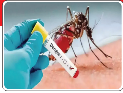
తీసుకోకపోతే వ్యాధులతో ప్రమాదం పొంచిఉంటుంది. పర్వకాలం తడవకుండా ఉండేందుకు తగు జాగ్రత్తలు అవసరం.

డెంగ్యూ: పర్వకాలంలో అతివేగంగా వ్యాపించే ప్రమాదకరమైన వ్యాధి. ఎడిస్ ఈజిప్ట్ అనే దోమ కాటువల్ల ఈ వ్యాధి వస్తుంది. విపరీతమైన జ్వరం, ఫ్లేబ్ లెట్స్ పడిపోవడం, తలనొప్పి, కీళ్ళనొప్పులు, శరీరంపై దద్దుర్లు, జలుబు, దగ్గు ఈ వ్యాధి లక్షణాలు. జ్వరం పస్తూ పోతూ ఉంటుంది. మలేరియా: ప్లాస్మోడియం అనే దోమ కుట్టడం వలన ఈ వ్యాధి సోకుతుంది. పర్వకాలంలో పరిసరాల పరిశుభ్రత లేకపోవడంతో ఈ దోమలు విపరీతంగా వ్యాప్తి చెందుతాయి. పర్వకాలంలో తగిన జాగ్రత్తలు