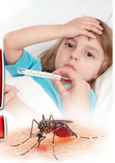
■ మణుగూరు, ప్రజాజ్యోతి