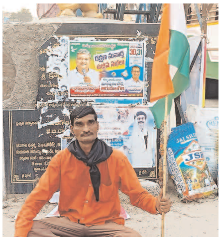
ఎదురొని తెలంగాణ రాష్ట్ర ఆకాంక్షలో భాగస్వామిని పోరాటం చేసినవారిని గుర్తించకుండా,ఎవరెవరినో గుర్తించి రాష్ట్ర అవతరణ దినోత్సవ సందర్భంగా