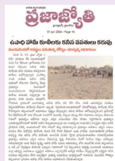
ఉపాధి హామీ కూలీలకు కనీస పసతులు కరువు... ప్రజా జ్యోతి వార్తకు స్పందన

మాతె జూన్ 1 (ప్రజా జ్యోతి): కనీస పసతులు లేకుండా మందులెండలు నిడవనీడ లేకుండా త్రాగేందుకు నీరు లేక ఉపాధి హామీ కూలీలకు కనీస పసతులు కరువయ్యాయని మే 31 తారీకున ప్రజా జ్యోతి దినపత్రిక లో ప్రచురించిన కథనానికి అధికారులు తక్షణమే స్పందించినీడ కోసం టెంట్ ను, చల్లటి మంచి నీటి సదుపాయాన్ని ఏర్పాటు చేయడంతో పాటు ఓఆర్ఎస్ జూసులను కూలీలకు అందుబాటులో ఉంచారు. తక్షణమే ఈ సదుపాయాలను అందుబాటులో తెచ్చిన అధికారులకు ఉపాధి హామీ కూలీలు కృతజ్ఞతలు తెలపడంతో పాటు పలు సామాజిక కథనాలను వెలికి తీస్తున్న ప్రజా జ్యోతి దినపత్రికకు పలువురు గ్రామస్థులు కృతజ్ఞతలు తెలుపుతూ అభినందించారు.