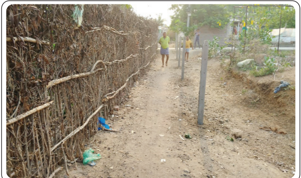
బూర్గంపహాడ్, జూన్ 1, ప్రజాజ్యోతి:

సుమారు 30 నుంచి 50 కుటుంబాలు నివసిస్తున్న గ్రామంలో రహదారు లేక నానా అవస్థలు పడుతున్నాయి. ఏదైనా ఎమర్జెన్సీ వస్తే ఆ వైపు కనీసం ఆటో గాని అంబులెన్స్ కానీ వచ్చే పరిస్థితి లేదని తమకు రోడ్డు శాంక్షన్ అయినా ఆక్రమణ కావడంతో రోడ్డు శాంక్షన్ అయినది కూడా వెనక్కి పోయిందని వెంటనే మాకు