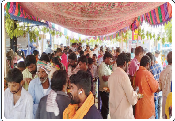
బూర్గంపహాడ్, జూన్ 1, ప్రజాజ్యోతి:

బూర్గంపాడు మండలం సారపాక లో హనుమాన్ జన్మదినోత్సవం సందర్భంగా అంజన్ ఆనియన్స్ ట్రేడర్స్ వారి ఆధ్వర్యంలో ఉదయం హనుమాన్ చాలీసా నిర్వహించారు. మధ్యాహ్నం వివిధ ప్రాంతాల నుండి రామ మాల ధరించి వచ్చిన రామ భక్తులకు మరియు గ్రామ ప్రజలకు సారపాక లో సుమారు 2000 మంది భక్తులకు అన్నదానం నిర్వహించారు. అదేవిధంగా అంజనా ఆనియన్స్ ట్రేడర్స్ ఆధ్వర్యంలో భద్రాచలంలోని సరోజినీ వృద్ధాశ్రమం నందు, కల్పవృక్ష నరసింహ స్వామి స్వామి ఆలయంలో భక్తులకు అన్నదానం చేశారు. ఈ సందర్భంగా అంజన ఆనియన్స్ ట్రేడర్స్ వారు మాట్లాడుతూ గత తొమ్మిది సంవత్సరాల నుండి హనుమాన్ జన్మదినోత్సవం సందర్భంగా భక్తులందరికీ అన్నదానం చేయడం ఎంతో సంతోషంగా ఉందన్నారు.