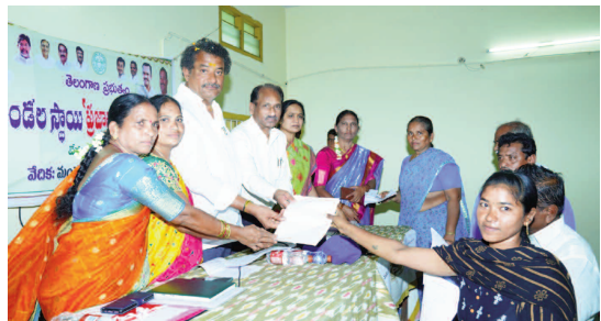
సమస్యలను పరిష్కరిస్తూ పాలనను ప్రజలకు చేరువచేసేందుకే 'ప్రజావాణి'