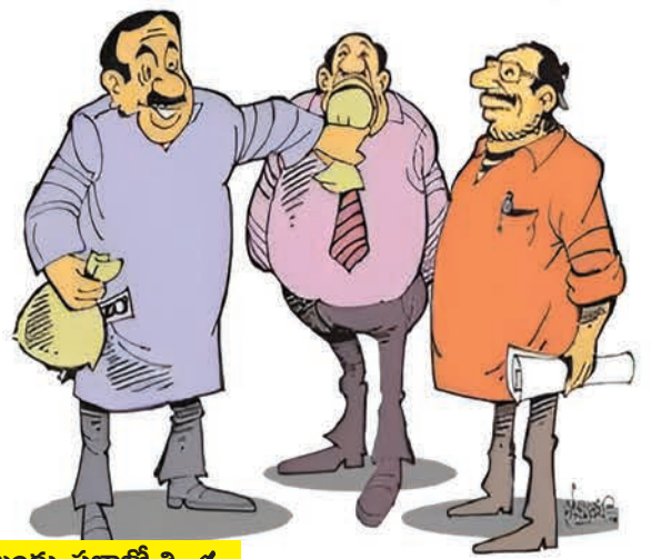
■ ఇల్లందు, ప్రజాజ్యోతి

సాధారణంగా ప్రభుత్వ ప్రభుత్వ రంగ సంస్థల్లో నిబంధనల మేరకే సుమారుగా 3 ఏళ్ళు పూర్తి కాగానే ఉద్యోగులు, సిబ్బందిని ఇతర ప్రాంతాలకు బదిలీ చేయడం సహజమే. కానీ సింగరేణి సంస్థ ఇల్లందు ఏరియాలో మాత్రం వాటికీ భిన్నంగా కొన్ని ఏళ్లుగా ఓకే ఏరియాతో పాటు ఓకే విభాగంలో తిప్ప వేసుకొని కూర్చున్న వారు ఉన్నారనడంలో ఎలాంటి అతిశయోక్తి లేదనే చెప్పాచ్చు. పైగా లాంగ్ స్టాండింగ్ లో ఓకే విభాగంలో ఉన్నవారు ఆయా శాఖలలో పెత్తనం చేయాల్సిస్తున్నట్లు సమాచారం. అంతేకాకుండా వారికి అనుకూలంగా ఉన్నవారికి పని భారం లేకుండా అన్ని వారై చూసుకుంటున్నట్లు తెలుస్తుంది. మరి ముఖ్యంగా ఆ విభాగ అధికారిపైనే పెత్తనం చలాయిస్తూ వారి ఇస్తాను సారంగా వ్యవహరిస్తున్నారనే అపవాదు లేకపోలేదు. లాంగ్ స్టాండింగ్ సిబ్బంది సమయపాలన పాటించకుండా వారికి ఇష్టం వచ్చిన సమయానికి వచ్చి మస్టర్ వేసుకొని ఎదో మొక్కుబడిగా విధులు పూర్తి చేసుకొని ముందుగానే ఇంటికి వెళ్తున్నట్లు జోరుగా ప్రచారం జరుగుతుంది. మరి ముఖ్యంగా ఇల్లందు సింగరేణి వైద్యశాలలో ఇదే తంతు కొనసాగుతుందనే ప్రచారం జరుగుతుంది. విధుల పట్ల నిర్లక్ష్యం వహిస్తూ, ఇస్తాను సారంగా వ్యవహరిస్తూ, ఆ శాఖపై పెత్తనం చేస్తూ, ఆ శాఖ బాధ్యుల మాటలను పెడ చెవిన పెడుతూ లాంగ్ స్టాండింగ్ గా ఓకే విభాగంలో కొనసాగుతున్నవారిని గుర్తించి బదిలీ చేయాలని పలువురు కార్మికులు కోరుతున్నారు.