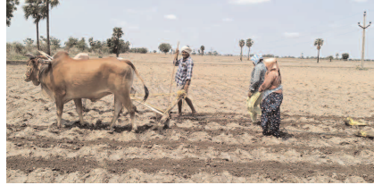
గతంలో ప్రతి రైతు ఇంటి వద్ద కాడెడ్లు, ఎడ్లబండ్లు రైతుకు అండగా ఉండేవి.

నిడమనూరు, జూన్ 21(ప్రజా జ్యోతి): ఒకప్పుడు ఏరువాక పార్లమెంటు అంటే ఇంట్లో ఉన్న కాడెడ్లుకు పూజలు చేసి, వ్యవసాయానికి సంబంధించిన పనులను మొదలు పెట్టేవారు. కానీ ఇప్పుడు కాలం మారింది. దుక్కి దున్నాలన్నా.. విత్తు వేయాలన్నా.. పండించిన పంట ఇంటికి చేరాలన్నా ఒకప్పుడు కాడెడ్లు, ఎడ్లబండిని ఉపయోగించేవారు. కానీ ఇప్పుడు వ్యవసాయంలో యాంత్రికరణ నేపథ్యంలో ట్రాక్టర్లు ఇతర పరికరాలు అందుబాటులోకి వచ్చాయి. ఈ క్రమంలో ఎడ్లబండి జాడ ప్రస్తార్థకంగా మారింది.