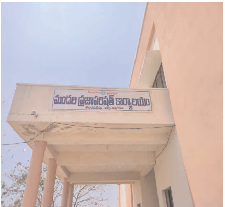
చేసుకోవాలని ఇట్టి అవకాశాన్ని సద్వినియోగం చేసుకోవాలని ఎంపీడిఓ రామ్ రెడ్డి ఒక ప్రకటనలో తెలిపారు.

స్వీకరించటం జరుగుతుంది. మరల మధ్యాహ్నం గం.3:00 గంటల నుండి సాయంత్రం గం.4:30.ని వరకు వచ్చిన ఫిర్యాదులపై పరిశీలన చేయబడుతుంది. ప్రజావాణి కార్యక్రమంలో విద్య, ఆరోగ్యం, వ్యవసాయం, ఉపాధి హామీ, రెవెన్యూ మరియు వివిధ శాఖలకు సంబంధించిన ఫిర్యాదులను స్వీకరించటం జరుగుతుంది. ప్రజావాణి కార్యక్రమమునకు వివిధ శాఖల మండల అధికారులు, పంచాయతీ కార్యదర్శులు తప్పని సరిగా హాజరు కావాలి. కావున మండల స్థాయిలో నిర్వహించే ప్రజావాణి కార్యక్రమమును మండలంలోని ప్రజలు సంబంధిత ఆధార పత్రములతో ఫిర్యాదులు