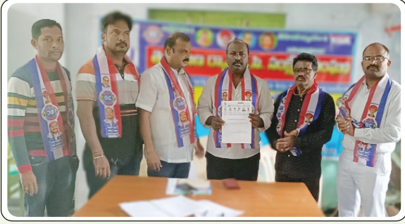
ఇల్లందు, జూన్ 21, ప్రజాజ్యోతి: