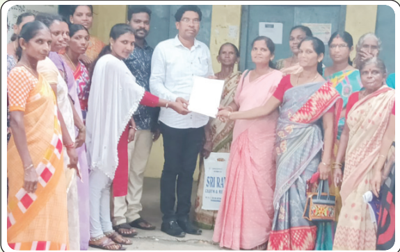
మణుగూరు రూరల్, జూన్ 21, ప్రజాజ్యోతి: