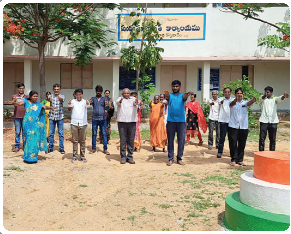
అళ్లపల్లి, జూన్ 21, ప్రజాజ్యోతి