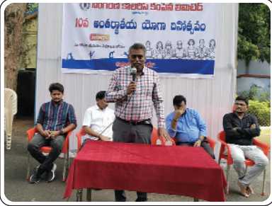
ఇల్లందు, జూన్ 21, ప్రజాజ్యోతి: