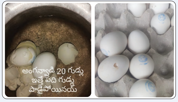
అంగన్వాడి 20 గుడ్లు ఇత్యే పది గుడ్లు పాడైపోయినయే