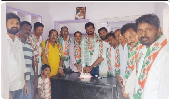
దుమ్మిగూడెం, జూన్ 19, ప్రజాజ్యోతి: