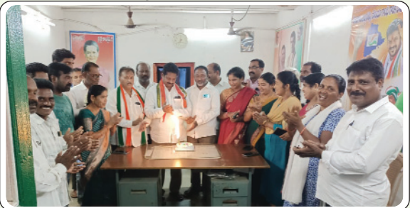
ఇల్లందు, జూన్ 19, ప్రజాజ్యోతి