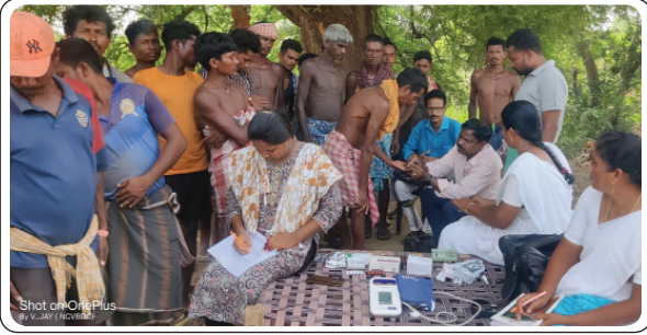
అశ్వారావుపేట, జూన్ 18 ప్రజాజ్యోతి:

- మలేరియా ప్రభావిత గ్రామాల్లో దోమల మందు పిచికారి