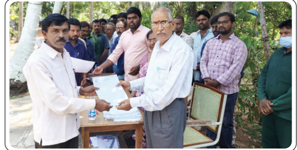
అశ్వారావుపేట, జూన్ 18, ప్రజాజ్యోతి:

- ఆశ్రమం హాస్పిటల్(పలూరు) ఆధ్వర్యంలో కెమిలాయిడ్స్ ఫ్యాక్టరీలో ఉచిత వైద్యశిబరం