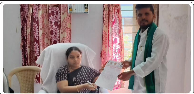
జూలూరుపాడు, జూన్ 18, ప్రజాజ్యోతి