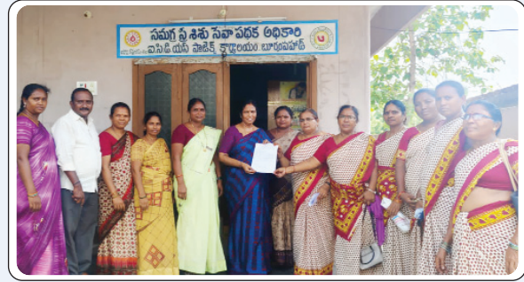
బూర్గంపహాడ్, జూన్ 18, ప్రజాజ్యోతి: