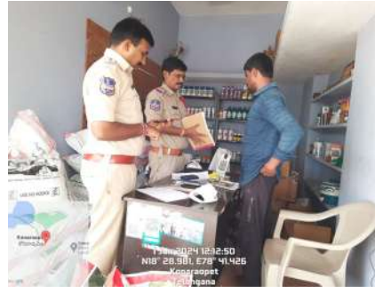
వేసిన తరువాత ఖాళీ బ్యాగులను, రశీదులను భద్రపరచుకోవాలన్నారు. లైసెన్సు కలిగిన డీలర్ల వద్దనే