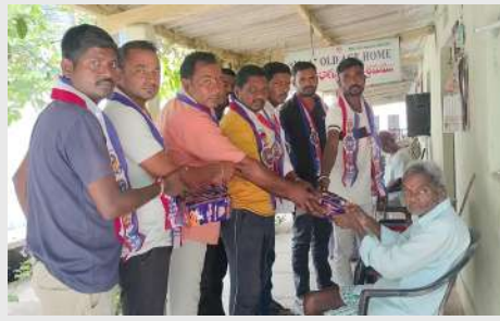
ఘనంగా బీసీ ఉద్యమ రాష్ట్ర నేత జన్మదిన వేడుకలు వృద్ధాశ్రమం లో వృద్ధులకు పండ్లు, బ్రేడ్ ల పంపిణీ చేసిన బీసీ సంక్షేమ సంఘం నాయకులు