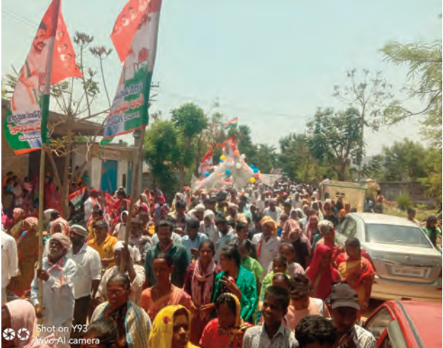
దుర్గాప్రసాద్ నాయకులు కార్యకర్తలు జిల్లా నాయకులు సీనియర్ నాయకులు తదితరులు పాల్గొన్నారు.