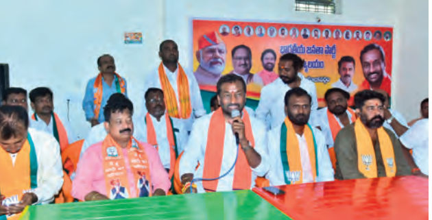
బీఆర్ఎస్ కార్పర్ మీటింగ్ లో తనపై మాజీ సీఎం కేసీఆర్ చేసిన వ్యాఖ్యలకు ఆయన మాట్లాడుతూ కామారెడ్డిలో ఓడి... తెలంగాణలో 17 సీట్లు ఎలా

సిద్దిపేట ప్రతినిధి ప్రజాజ్యోతి: సిద్దిపేట జిల్లా కేంద్రంలోని బిజెపి పార్టీ కార్యాలయంలో బుధవారం మీడియా సమావేశం నిర్వహించారు మెదక్ బిజెపి ఎంపీ అభ్యర్థి రఘునందన్ రావు. ఈ సందర్భంగా ఆయన మెదక్ జిల్లా కేంద్రంలో