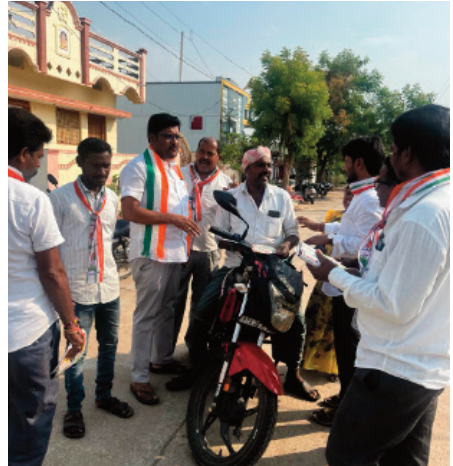
ప్రజా జ్యోతి, సిద్దిపేట, కొండపాక : మహిళలకు ఊ