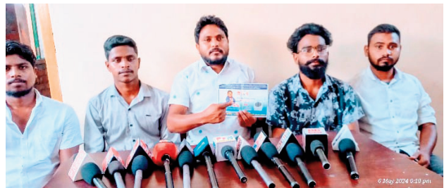
బహుజనుల హక్కుల, సమగ్రాభివృద్ధి సాధనకు కృషి చేస్తానని బలంగా హామీ ఇచ్చారు.

స్కాలర్లు, దళిత ఉద్యమ, సామాజిక ఉద్యమ కారుడినైనా నేను ఈ లోక సభ ఎన్నికలలో స్వతంత్ర అభ్యర్థిగా పోటీలో ఉన్నానని తన గుర్తు కూలర్ పై ఓట్లేసి భారీ మెజారిటీతో గెలిపించాలని కోరారు. నేను గెలిస్తే విద్యా, వైద్యం,దళిత,