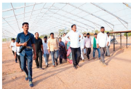
తాండూరు మే 5 ప్రజా జ్యోతి:- ఈ నెల 10న తాండూరు పట్టణంలో జరిగే భారీ బహిరంగ సభకు విఘ్నేశీ ప్రధాన కార్యదర్శి ప్రియాంక గాంధీ, రాష్ట్ర ముఖ్యమంత్రి రేవంత్ రెడ్డి హాజరుకానున్నట్లు ఎమ్మెల్యే మనోహర్ రెడ్డి వెల్లడించారు. ఈనెల 10న

- సమావేశ ప్రాంగణాన్ని పరిశీలించిన ఎమ్మెల్యే