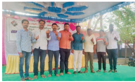
తాండూర్ మే 5 ప్రజా జ్యోతి:- ఈ నెల 13న జరగనున్న లోక్ సభ ఎన్నికలను పురస్కరించుకొని ఎన్నికల విధి నిర్వహణలో పాల్గొనే అధికారులకు