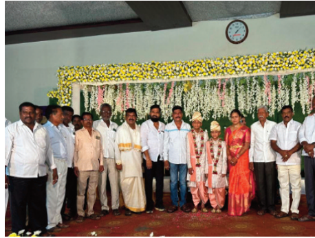
కొత్తూరు మే 05 (ప్రజా జ్యోతి) రంగారెడ్డి జిల్లా