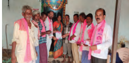
తాండూర్ మే 3 ప్రజా జ్యోతి:- ఈనెల 13న జరిగే

- బీసీలందరూ ఏకమవ్వాలి బీఆర్ఎస్ అభ్యర్థిని గెలిపించాలి