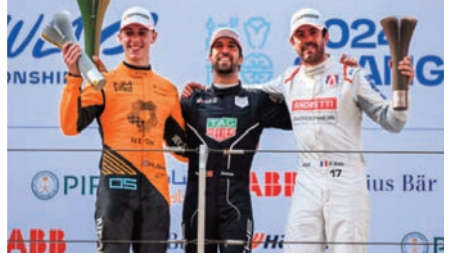
హైదరాబాద్, మే 30 (ప్రజా జ్యోతి) : ఏబీబీ ఎఫ్ఐఐఐ ఫార్ములా-ఇ వరల్డ్ ఛాంపియన్ షిప్ రౌండ్ 11లో

జాగ్వార్ టీవీఎస్ రేసింగ్ లో ఎవాన్స్ క్యాసిడీ విజయాన్ని చేజిక్కించుకున్నట్లు ఫార్ములా-ఇ రేసింగ్ ప్రతినిధులు గురువారం నగరంలో విడుదల చేసిన ఒక ప్రకటనలో పేర్కొన్నారు. గ్రిడ్ లో ఎవాన్స్ ల్యాప్-7 ద్వారా ముందు స్థానానికి చేరుకున్నట్లు తెలిపారు. పోల్ సెట్ జీన్-ఎరిక్ వెర్నె (డీఎస్ పెన్ సిక్) నిస్సాన్ ఆలివర్ రోలాండ్లను అధిగమించి, ఎవాన్స్ పోర్చుగల్ ఆఫ్ వెర్నెస్ ఆంటోనియో ఫెలిక్స్ డా కోస్టా రెండింటినీ తీసుకున్నట్లు తెలిపారు. ప్రస్తుత ఛాంపియన్ జేక్ డెన్విస్ (ఆండ్రెట్టి ఫార్ములా ఈ టీమ్) క్లుప్తంగా లీడ్ గ్రూప్ లో చేరారని చెప్పారు.