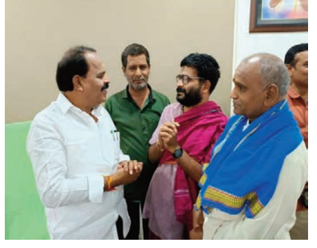
సందిగామ, మే 30 (ప్రజా జ్యోతి): బ్రాహ్మణుల

- షాద్ నగర్ ఎమ్మెల్యే "వీర్లపల్లి శంకర్"