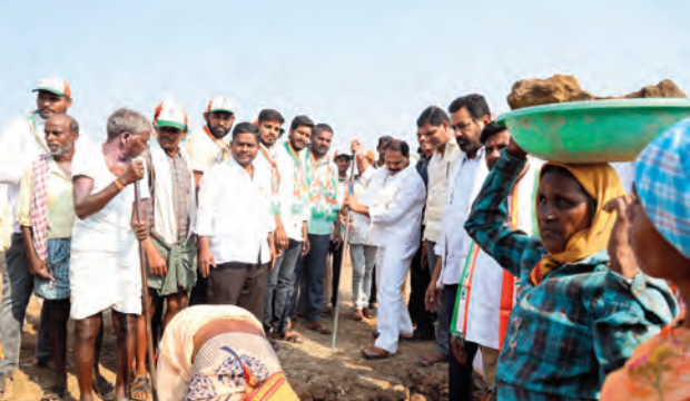
కోరారు. ఈ కార్యక్రమంలో కాంగ్రెస్ నాయకులు, కార్యకర్తలు మరియు గ్రామస్థులు తదితరులు పాల్గొన్నారు.