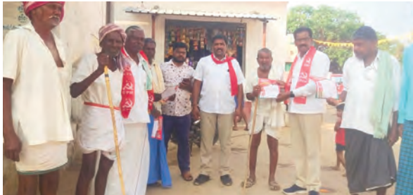
ఇతర నాయకులు పాల్గొన్నారు.