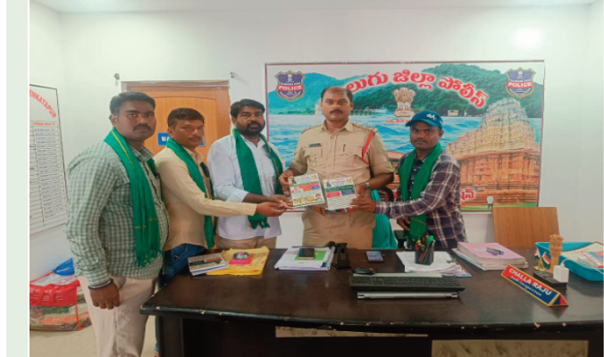
వెంకటాపూర్/ములుగు, మే 20 (ప్రజా జ్యోతి): ములుగు జిల్లా వెంకటాపూర్ మండలం రామానుజాపూర్ గ్రామ పంటపొలాల మధ్య ఉన్న నాంచారమ్మ జాతర, మే 23న మహాజాతర