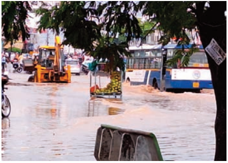
ఎల్దీనగర్ ప్రజా జ్యోతి ప్రతినిధి నేడు సాయంత్రం

కురిసిన భారీ వర్షానికి చింతలకుంట చెక్ పోస్ట్ వద్ద ట్రాపిక్ జామ్ అయ్యింది. బస్సు ట్రెప్పు మునిగేంతవరకు వర్షపు నీరు చేరుకుంది. దీనికి పరిష్కార మార్గం లేదా? కొద్దిపాటి వర్షానికి జాతీయ రహదారిపై వర్షపు నీరు నడుము లోతు నీరు రావడంతో ప్రజలు ప్రాణాలు హరి చేతిలో పెట్టుకొని వెళ్లి పరిస్థితి ఏర్పడింది. వాహనదారులు, పాదాచారులు నానా ఇబ్బంది పడుతున్నారు. సంబంధిత అధికారులు, ప్రజా ప్రతినిధులు వెంటనే స్పందించి తగిన చర్యలు తీసుకోవాలని కోరినారు లేనియెడల ప్రజల ఆగ్రహానికి గురి కాక తప్పదు అని అక్కడ ప్రజానీకం తెలియజేశారు.