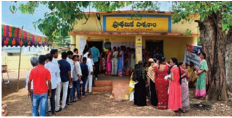
నవాబుపేట్ మే 13 (ప్రజా జ్యోతి) నవాబుపేట్

- నవాబుపేట్ మండల పరిధిలో 70.7 శాతం పోలైన ఓట్లు