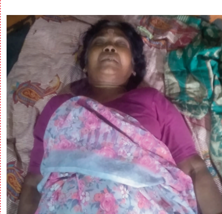
నాగిరెడ్డిపేట్ మే 13(ప్రజా జ్యోతి) పాము కాటుకు