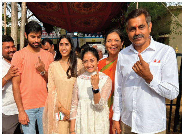
చేవెళ్ల మే 13(ప్రజా జ్యోతి): ప్రజలంతా ఓటింగ్ లో భాయమన్నారు.