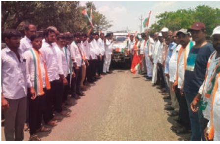
బషీరాబాద్ మే 11 ప్రజా జ్యోతి పార్లమెంట్ ఎన్నికల సందర్భంగా తాండూర్ లో జరిగే జన జాతర సభకు ప్రయాణం గాంధీ, రాష్ట్ర ముఖ్యమంత్రి రేవంత్ రెడ్డి,