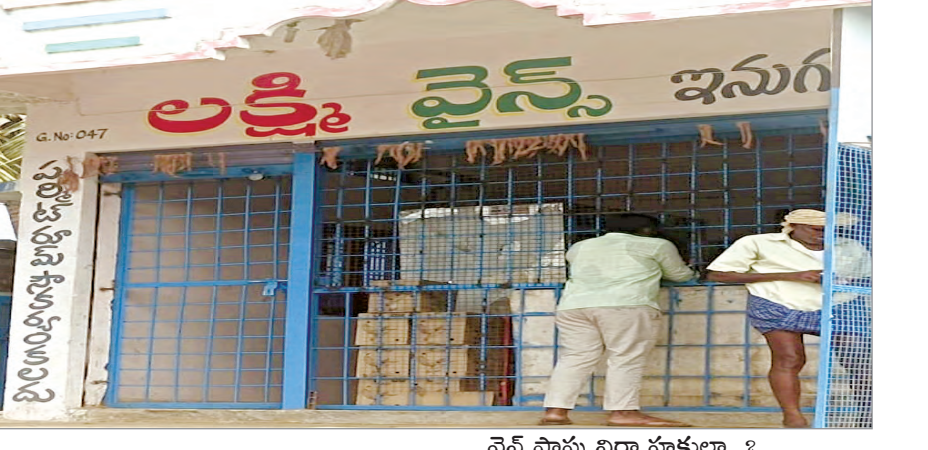
వైస్ షాపు నిర్వాహకులూ..?

ఇసుగుర్తి మే 10 (ప్రజా జ్యోతి): మండలంలోని శ్రీ లక్ష్మి వైస్ షాపు యాజమానులు కేసుమర్రి వైస్ యాజమానులతో సిండికేట్ గా ఏర్పడి మద్యం సీసాలపై స్ట్రీకర్లను వేసుకుంటూ అధిక ధరలకు బెల్ట్ షాపులకు అమ్ముతుంటున్నారు. రాష్ట్రమంతటా బీర్ల కొరత ఉన్న విషయం అందరికీ తెలిసిందే కాని సిండికేట్ గా ఏర్పడిన యాజమానులు ఇసుగుర్తి మారుమూలన ఉండటంతో ఎవరికీ అనుమనం కాకుండా, గుట్టుచప్పుడు కాకుండా, అర్ధరాత్రి పూట లక్ష్మి వైస్ నుంచి చుట్టూ ప్రక్క గ్రామాల బెల్ట్ షాపులకు, ఇతర మండలాలకు మద్యం తరలిస్తున్నారనే చర్చ మండలంలో బహిరంగంగానే జరుగుతుండటంతో వైస్ షాపు పై మా ప్రజా జ్యోతి ప్రతినిధి నిఘా పెట్టగా వైస్ తతంగం మా ప్రతినిధి కెమెరాకు చిక్కింది..