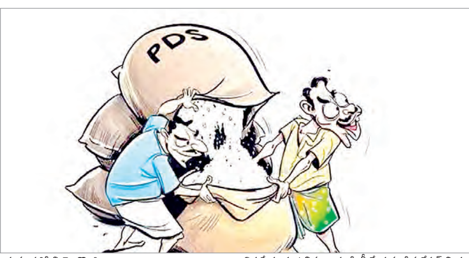
నిరుపేదలకు ఉచితంగా పంపిణీ చేయవలసిన రేషన్ బియ్యాన్ని లబ్ధిదారుల నుండి తమ పెట్టియంకొని బియ్యం ఇవ్వకుండా ఏడు రూపాయల వాపున ఖరీదు చేసుకొని డీలర్ల వీ

ఇసుగుర్తి మే10(ప్రజా జ్యోతి): మండలంలోని కొంత మంది రేషన్ డీలర్ల అగడాలకు అడ్డు అడుపు లేకుండా పోయింది. పేదలకు ప్రభుత్వం పంపిణీ చేస్తున్న రేషన్ బియ్యాన్ని ఇవ్వవలసిన రేషన్ డీలర్ల బరితెగించి మరి దండా చేస్తున్నారు. బియ్యం పంపిణీ చేయవలసిన రేషన్ డీలర్ల తిరిగి బియ్యాన్ని కొంటు తిరిగి అధిక ధరలకు అమ్ముతుంటున్నారు. అంతే కాకుండా బియ్యానికి బదులుగా నువ్వు, సబ్బులు, చక్కెర, ఉప్పు