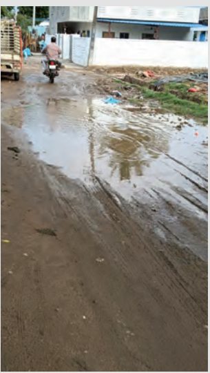
లేకుంపల్లి, మే 10, ప్రజాజ్యోతి:

మండలంలోని ఎన్నో కాలనీలో వర్షం పడితే చిత్తడే అన్న చందంగా ఉంటుంది ఆ రోడ్డు పరిస్థితి. నీరు పేరుకుపోవడం వల్ల ఎన్నో కాలనీ ప్రజలు రోగాల బారిన పడతారు. పరిస్థితి నెలకొంది. ఎన్నికల సమయంలో ఓట్ల కోసం వచ్చి మీకు అది చెప్పా... ఇది చెప్పమని ప్రగల్భాలు, లేనిపోని వాగ్దానాలు చేసి ఓట్లు వేశాక ప్రజలను వారు ఎదుర్కొంటున్న సమస్యలను పట్టించుకున్న నాథుడే కరువయ్యారనేది వాస్తవం. ఓట్లతో గెలిచి గద్దెనెక్కిన తరువాత అటువైపు కన్నెత్తి చూడడం లేదనే ఆరోపణలు ఉన్నాయి. కనీసం ఇండ్ల మధ్యలో ఉన్న డ్రైనేజీలలో పేరుకుపోయిన చెత్తను సైతం తొలగించకపోవడం వల్ల వర్షం వస్తే నీరు అంత రోడ్డు పైకి వచ్చి ప్రజలు ఇబ్బందులు పడుతున్నారు.