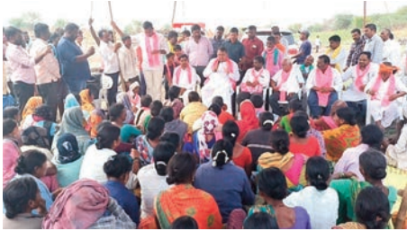
కోటగిరి, మే 10, ప్రజా జ్యోతి. బాన్సువాడ