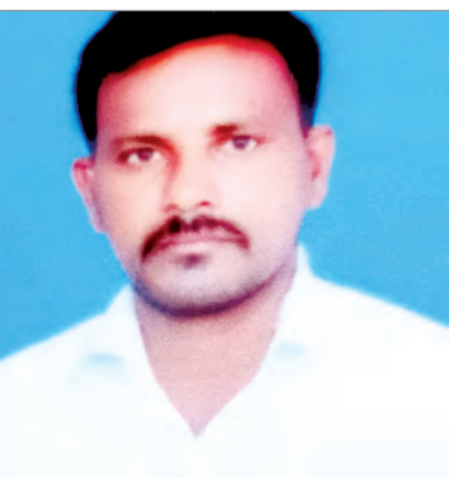
ఎన్నికల్లో బిజెపి చెప్పాలన్నారు. బీసీలపై బిజెపికి చిత్తశుద్ధి ఉంటే 50% రిజర్వేషన్లు పెడతామని ప్రకటించాలని ఆయన డిమాండ్ చేశారు. లేదంటే ఈ ఎన్నికల్లో బిజెపికి గుణపా

రం చెప్పాలని హెచ్చరించారు. మండల్ కమిషన్ సిఫారసు అమలు కాకుండా బిజెపి కుట్ర చేసింది, బీసీ రిజర్వేషన్లు అమలు చేయకుండా, బీసీ కులగణం చేయకుండా అడుగు దుగునా బీసీలకు బిజెపి పార్టీ అభ్యాయం చేసిందన్నారు. బిజెపిని గద్దె దించి ఇండియా కూటమికి ఓటు వేయాలని ఆయన బీసీలను కోరారు. బీసీ ప్రధానమంత్రిని చెప్పి కుటుంబం నరేంద్ర మోదీకి బీసీల పట్ల విమాత్రం చిత్తశుద్ధి లేదన్నారు. పైగా ప్రధానిని అనేకపార్లు బీసీ సంఘాలు కలిసి విన్నవించిన, ఆరోపించిన ఆమోదం లేకుండా బీసీల సమస్యలను పరిష్కరించే దమ్ము, ధైర్యం నరేంద్ర మోదీకి లేదన్నారు. బీసీల సమస్యల పరిష్కారం కోసం ఇండియా కూటమి, అలాగే కాంగ్రెస్ సారాధ్యంలోని రాహుల్ గాంధీ సిద్ధంగా ఉన్నారని, బీసీల డిమాండ్ల నిరవేర్ణుడని చిత్తశుద్ధిలో పనిచేస్తున్నారని, అందుకే ఈ లోక్ సభ ఎన్నికల్లో దేశ వ్యాప్తంగా కాంగ్రెస్ నేతృత్వంలో ఏర్పడిన ఇండియా కూటమికి బీసీ సంక్షేమ సంఘం తరఫున సంపూర్ణ మద్దతు తెలియజేస్తున్నట్లు ఆయన తెలిపారు.