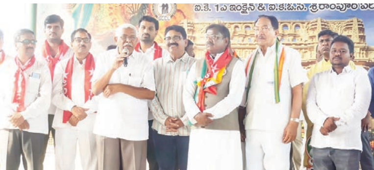
బి.కె. 1వ ఇంకైన్ & బి.కె.ఓ.ఓ.న. శ్రీరాంపూర్ వారి