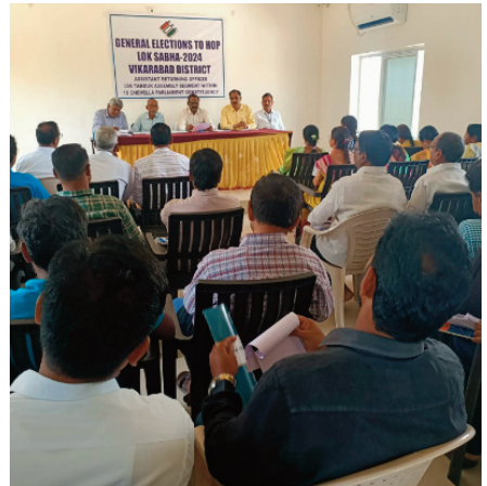
తాండూర్ మే 9 ప్రజా జ్యోతి :- వికారాబాద్ లో జరుగుతున్న లోక్ సభ ఎన్నికల కోసం ఏర్పాటుచేసిన