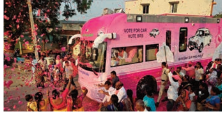
మర్నాక్ మే 09(ప్రజాజ్యోతి ) కరీంనగర్ బిఆర్ఎస్ లోక్ సభ అభ్యర్థి వినోద్ కుమార్ గెలుపు కు మద్దతుగా రోడ్ షో కు బయలుదేరిన గులాబీ అధినేత మాజీ ముఖ్యమంత్రి కేసీఆర్.మర్నాక్ మండలం ఎర్రవల్లి గ్రామంలో మాజీ ముఖ్యమంత్రి తన

వ్యవసాయ క్షేత్రం నుండి పెద్ద ఎత్తున బిఆర్ఎస్ పార్టీ శ్రేణులతో కెసిఆర్ దత్తత గ్రామమైన ఎర్రవల్లి మీదుగా కరీంనగర్ రోడ్ షో కు బయలుదేరారు. ఎర్రవల్లి గ్రామ బిఆర్ఎస్ ముఖ్య నేతల ఆధ్వర్యంలో గ్రామ మహిళలు మంగళ హారతులు ఇస్తూ ఘనంగా స్వాగతం పలికారు.గుమ్మడికాయలతో దిష్టి తీసి గులాబీ అధినేతను ఘనంగా సాగనంపారు. కార్యక్రమం అనంతరం బిఆర్ఎస్ పార్టీ ప్రచార రథమైన బస్సులో కరీంనగర్ కు బయలుదేరారు. కరీంనగర్ రోడ్ షో మీటింగ్లో కాంగ్రెస్ మోసపూరిత వాగానాలను ప్రజలకు క్షుణ్ణంగా వివరించారు. భారీ మెజారిటీతో బిఆర్ఎస్ లోక్ సభ అభ్యర్థులను గెలిపించుకోవాల్సిందిగా రాష్ట్ర ప్రజలను కోరారు.