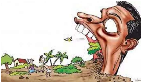
మునిగి తేలుతున్నారని స్థానిక ప్రజలు ఆరోపిస్తున్నారు.

రుద్రూర్, మే 22 (ప్రజా జ్యోతి) : ఖాళీ స్థలం కనిపిస్తే కబ్జా చేసేస్తారు.. అసైన్డ్, చెరువు శిఖం, కందకం.. అనే తేడా ఉండదు.. ఆక్రమించడం, వెంచర్లు వేయడం, ప్లాట్లు చేసి విక్రయించడం బహిరంగ రహస్యమైనా అధికారులు పట్టనట్లు వ్యవహరించడంతో మండల కేంద్రంలో గల ప్రభుత్వ స్థలాలు, చారిత్రక కందకాలు కనుమరుగవుతున్నాయి. రుద్రూర్ మండల కేంద్రంలో కొందరు వ్యక్తులు ఇప్టారాజ్యంగా వ్యవహరిస్తు యథేచ్ఛగా కందకాలను కబ్జా చేస్తున్నారని స్థానిక ప్రజలు ఆరోపిస్తున్నారు.. చెరువులోని పూడికతీత మట్టిని ట్రాక్టర్ ల ద్వారా కందకాల స్థలాల్లో వేస్తూ కందకాలను కబ్జా చేస్తున్నారని స్థానిక ప్రజలు వాపోతున్నారు.