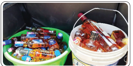
భద్రాచలం, మే 8, ప్రజాజ్యోతి: