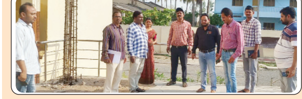
బూర్గంపహాడ్, మే 8, ప్రజాజ్యోతి:

బూర్గంపాడు మండలం లోని పలు పోలింగ్ బాత్ సెంటర్లను పరిశీలించిన పోలింగ్ అధికారులు. సారపాక లోని సెంట్ తెరిసా స్కూలు బిపిఎల్ స్కూలు గ్రామపంచాయతీ పలు ప్రాంతాలు స్థానిక ఎమ్మార్వో, ఎంపీడీవో, ఎంపీసీ, గ్రామ పంచాయతీ సెక్రటరీ సంయుక్తంగా పోలింగ్ కేంద్రాలను పరిశీలించారు మే 13వ తేదీన జరిగి ఎంపీ ఎన్నికల పనులు ఎంతవరకు జరుగుతున్నాయో ప్రత్యక్షంగా క్షేత్రస్థాయిలో పరిశీలించారు అధికారులకు తగిన సూచనలు చేశారు.