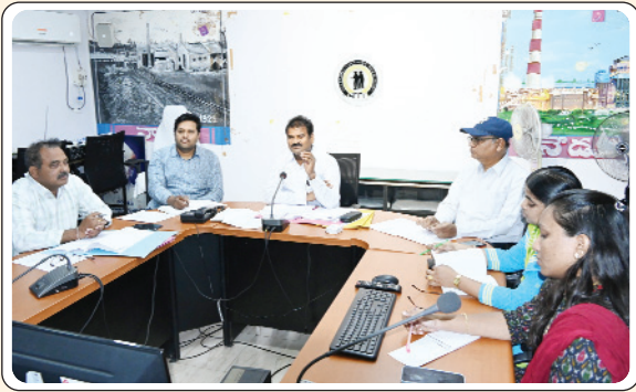
మణుగూరు చూరల్, మే 8, ప్రజాజ్యోతి: