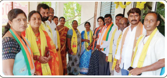
మణుగూరు, మే 8, ప్రజాజ్యోతి: