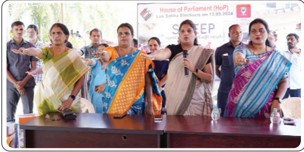
భద్రాద్రి కొత్తగూడెం బ్యూరో, మే 8, ప్రజాజ్యోతి