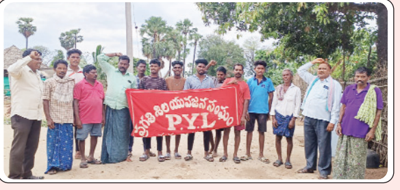
ములకలపల్లి, మే 7, ప్రజాజ్యోతి: