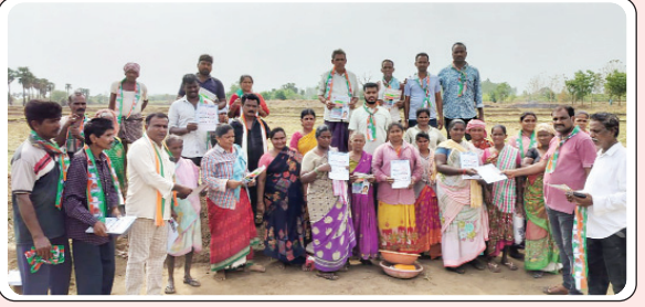
పినపాక, మే 7, ప్రజాజ్యోతి