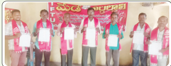
మణుగూరు రూరల్, మే 7, ప్రజాజ్యోతి: