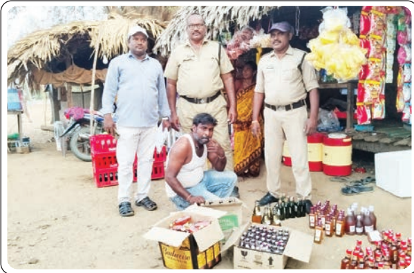
భద్రాచలం, మే 5, ప్రజాజ్యోతి