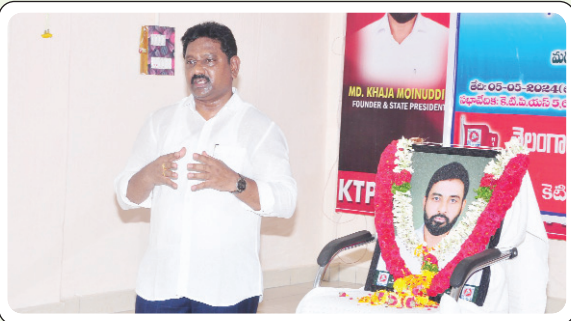
పాల్వంచ, మే 5, ప్రజాజ్యోతి: