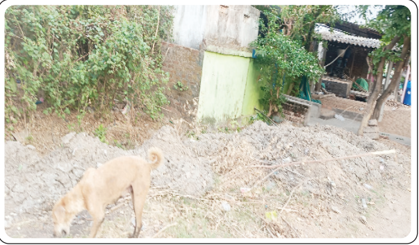
చర్ల, మే 5, ప్రజాజ్యోతి:

చర్ల మండల కేంద్రంలో పలుచోట్ల డ్రైనేజీ పూడికలు తీసి యధావిధిగా రోడ్డు ప్రక్కల వేసి పంచాయితీ సిబ్బంది ఆదమరిచారు. పూడిక తీసి రెండు వారాలు కావస్తున్న ఇంతవరకు పూడిక ట్రాక్టర్ల పై తోలని అధికార యంత్రాంగం, మరలా ఆ పూడిక వర్షం వస్తే డ్రైనేజీలో పడి డ్రైనేజీ నిండి దుర్వాసన వెదజల్లుతాయని స్థానిక ప్రజలు ఆవేదన వ్యక్తం చేస్తున్నారు. సంబంధిత అధికారులు చొరవ తీసుకొని డ్రైనేజీ పూడికలు ఎత్తివేయాలని కోరుతున్నారు.