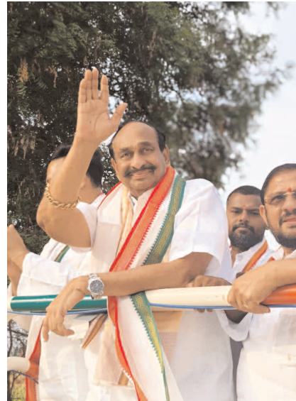
ఉద్యోగాలు ఇస్తానని యువతను, నిరుద్యోగులను